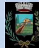
Comune San Pietro di Feletto