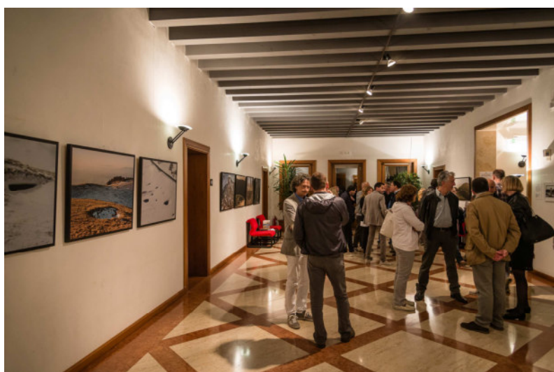
Sistema di illuminazione attuale del piano nobile

L'attuale impianto luci, tuttavia, non è in grado di favorire la fruizione dell'opera d'arte che necessita di essere valorizzata al meglio per evidenziarne colori e particolari.